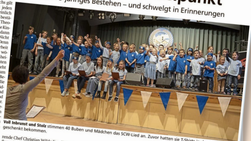
Voll Inbrunst und Stolz stimmen 40 Buben und Mädchen das SCW-Lied an. Zuvor hatten sie T-Shirts in den Vereinsfarben geschenkt bekommen.