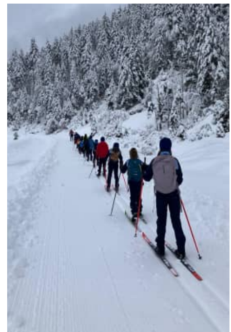
Training am Berg und in der Loipe