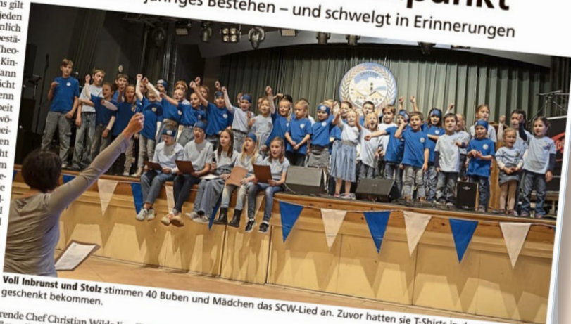
Voll Inbrunst und Stolz stimmen 40 Buben und Mädchen das SCW-Lied an. Zuvor hatten sie T-Shirts in den Vereinsfarben geschenkt bekommen.